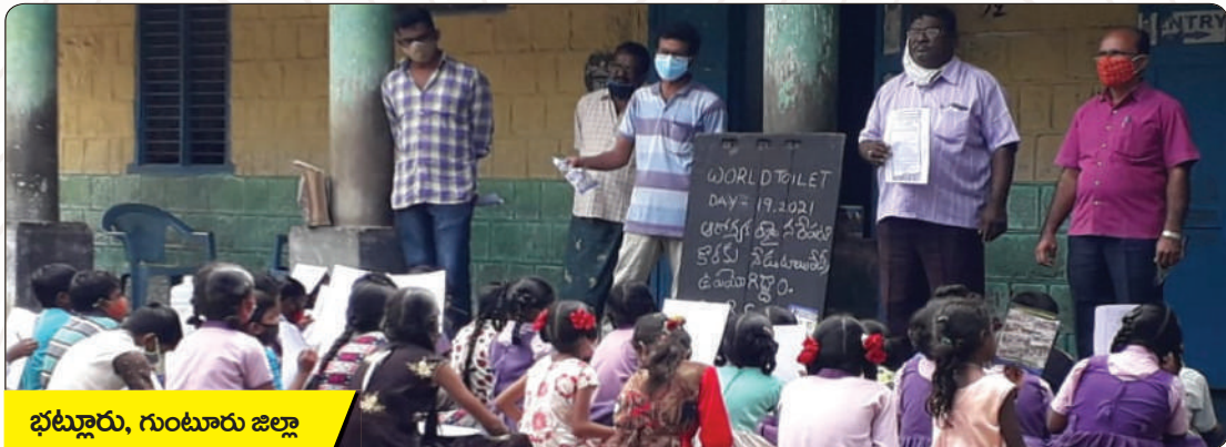
భట్లూరు, గుంటూరు జిల్లా