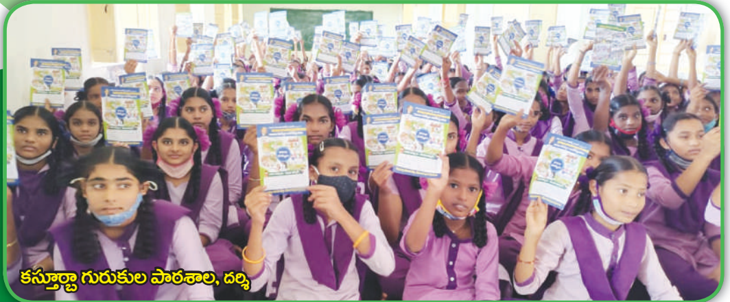
కస్తూర్బా గురుకుల పాఠశాల, దర్శి