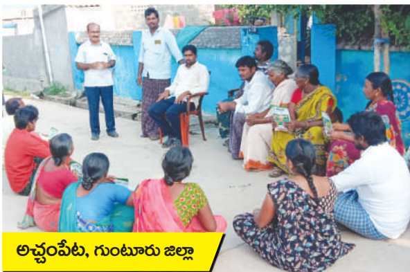
అచ్చంపేట, గుంటూరు జిల్లా

ఆవుపేడ వంటి సహజ ఎరువుల తయారీ మరియు పంట పొలాలకు సహజ ఎరువుల్ని వివిధంగా ఏయే సమయాల్లో ఎంత మోతాదులో వనియోగించాలనే మేళకువలను కూడా ఈ కార్యక్రమాలలో తెలియజేయడం జరిగింది. అదేవిధంగా ప్రకృతి వ్యవసాయంతో పాటుగా పశువుల పెంపకం, విత్తన తయారీ మొదలైన వ్యవసాయ అనుబంధ పనుల ద్వారా సమీకృత ప్రకృతి వ్యవసాయం ద్వారా మంచి ఆదాయం సంపాదించవచ్చని వివరించి చెప్పడం జరిగింది.