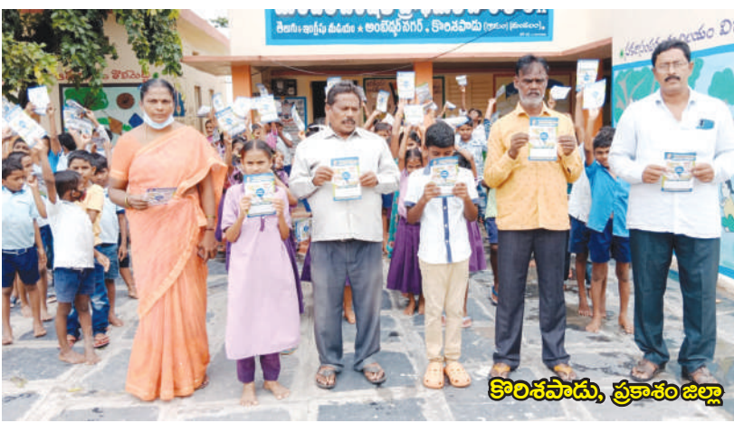
కొరికపాడు, ప్రకాశం జిల్లా

మొదలైన అంశాలపై కరపత్రాల పంపిణీ, నినాదాలు చెప్పించడం, స్పూర్తి కథలను వివరించడం ద్వారా అవగాహన కల్పించడం జరిగింది.