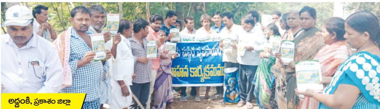
అద్దంకి, ప్రకాశం జిల్లా