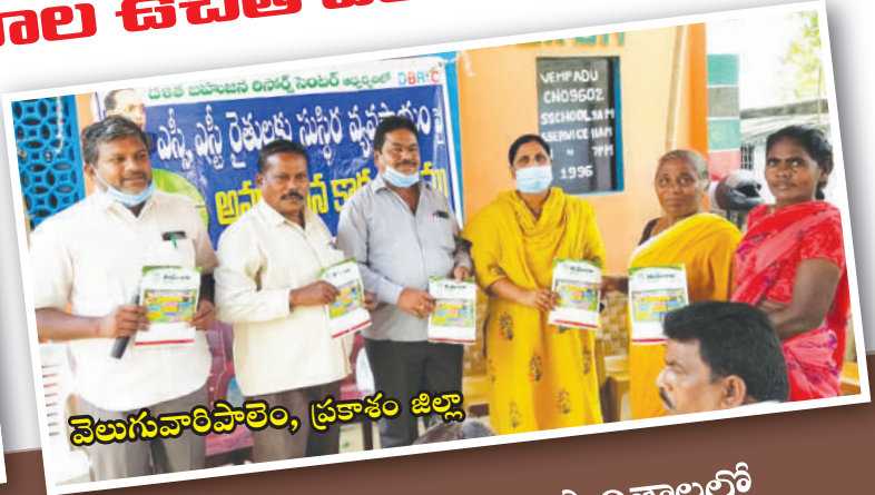
వెలుగువారిపాలెం, ప్రకాశం జిల్లా

పెరటి తోటలను ప్రోత్సహించే కార్యక్రమంలో భాగంగా డిబిఆర్‌సి పని ప్రాంతాలలో ఎస్సీ, ఎస్టీ కుటుంబాలకు దాదాపు 1300 మందికి 11 రకాల కూరగాయల విత్తనాలను ఉచితంగా పంపిణీ చేయడం జరిగింది.