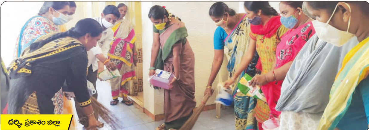
దర్శి, ప్రకాశం జిల్లా