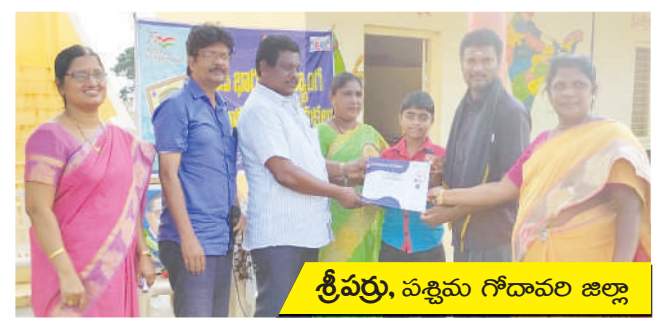
శ్రీవర్లు, పశ్చిమ గోదావరి జిల్లా