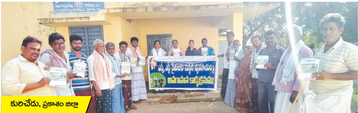
కురిచేడు, ప్రకాశం జిల్లా

అంతేకాక తక్కువ ఖర్చుతో సహజ ఎరువులతో తయారు చేసుకోగలిగే జీవామ్లం, కషాయాలు, ఆవుమూత్రం,