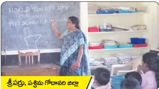
శ్రీపర్తి, పశ్చిమ గోదావరి జిల్లా