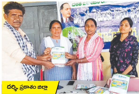
దర్శి, ప్రకాశం జిల్లా