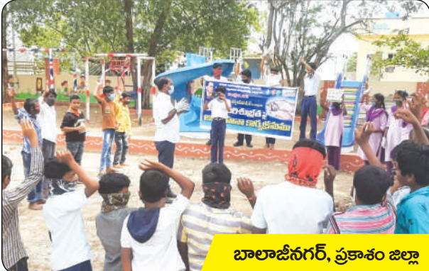
బాలాజీనగర్, ప్రకాశం జిల్లా