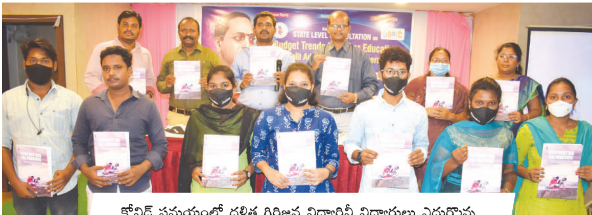
కోవిడ్ సమయంలో దళిత గిరిజన విద్యార్థిని విద్యార్థులు ఎదుర్కొన్న సవాళ్ళపై జాతీయ స్థాయిలో నిర్వహించిన అధ్యయన నివేదిక ఆవిష్కరణ