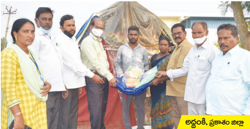
అద్దంకి, ప్రకాశం జిల్లా