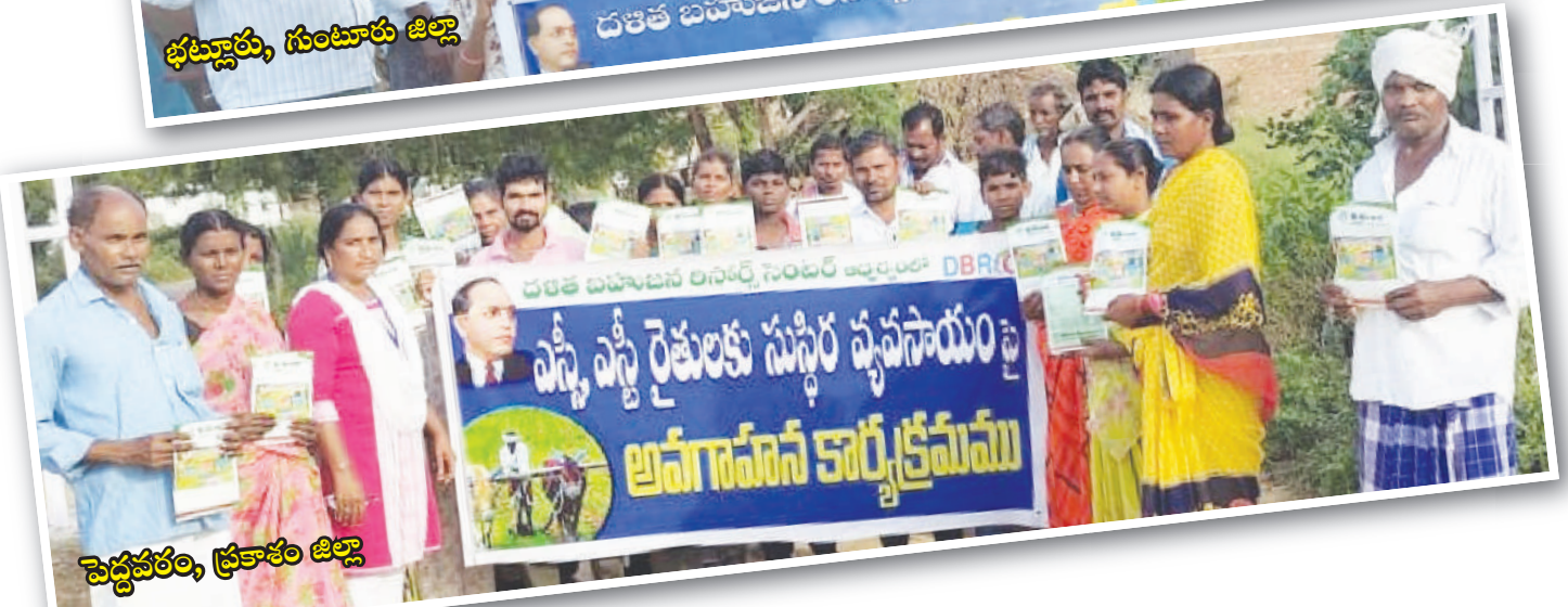
పెద్దవరం, ప్రకాశం జిల్లా