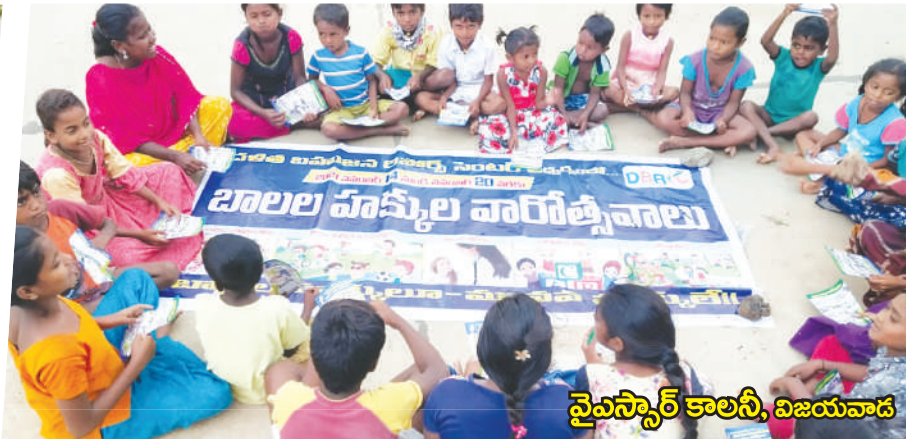
వైఎస్సార్ కాలనీ, విజయవాడ