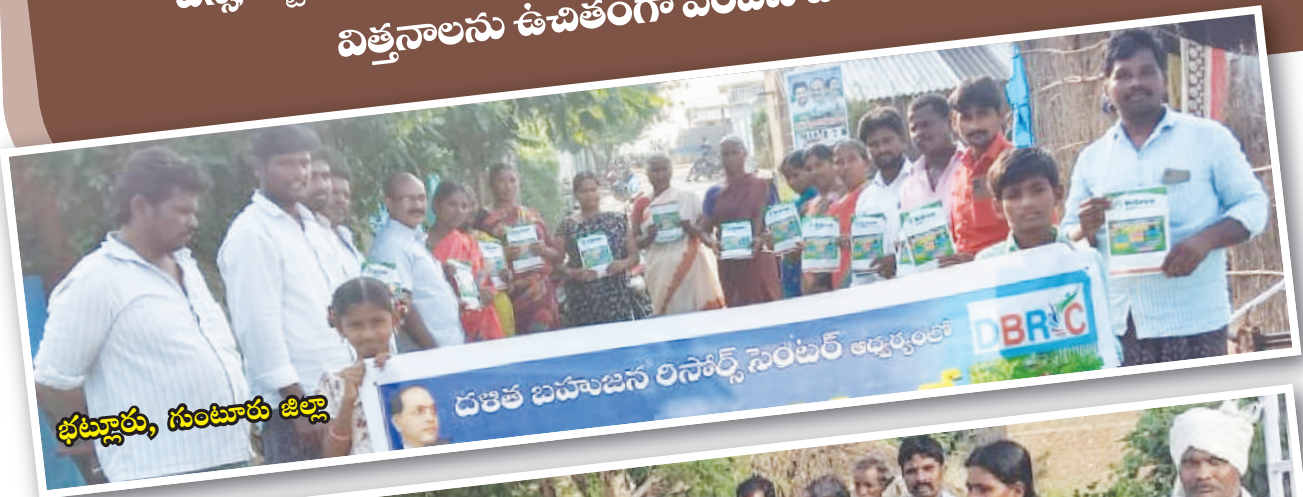
భట్లూరు, గుంటూరు జిల్లా

పెరటి తోటలను ప్రోత్సహించే కార్యక్రమంలో భాగంగా డిబిఆర్‌సి పని ప్రాంతాలలో ఎస్సీ, ఎస్టీ కుటుంబాలకు దాదాపు 1300 మందికి 11 రకాల కూరగాయల విత్తనాలను ఉచితంగా పంపిణీ చేయడం జరిగింది.